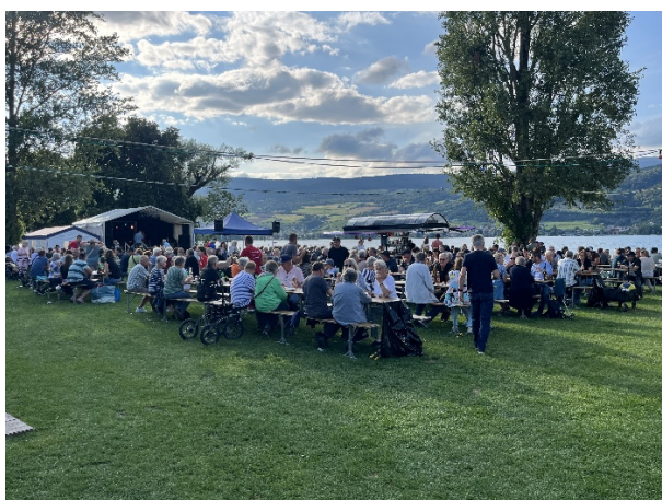
Impressionen vom Strandfest